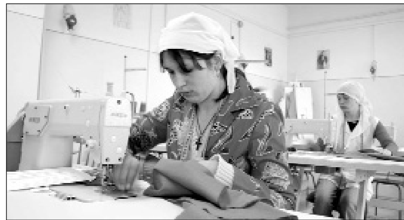
Atelierele pentru domeniul textile de la „Edmond Nicolau” își așteaptă cursanții

Înscrierile se fac în perioada 3 - 7 septembrie. Dacă numărul de candidați va depăși numărul de locuri, se va da concurs de admitere. Pentru domeniul textile-pielărie proba de admitere va consta într-un test grilă cu elemente de matematică și de specialitate privitoare la domeniul materiilor prime textile. Pentru domeniul construcții-montaj testul grilă se va da din disciplina „Organe de mașini”. Cunoștințele verificate vor fi cele acumulate în timpul liceului. Pentru domeniul construcții-montaj, metodologia de