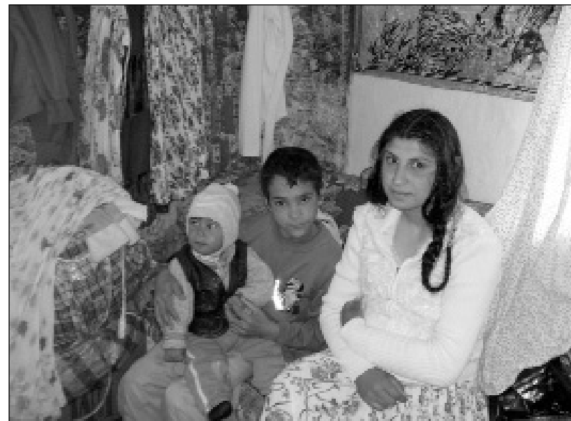
La 16 ani adolescența avea, deja, un copil de un an și urma să-l nască și pe al doilea

sănătății rromilor este una gravă, directorul Autorității de Sănătate Publică Brăila (n.r. - la momentul investigației, dr. Lucica Scutaru) susține că aceasta nu s-a născut din discriminare, ci chiar din lipsa de interes a rromilor față de propriile probleme și modalitățile de rezolvare ale acestora, modalități îmbrățișate de restul populației, dar nu și de ei.