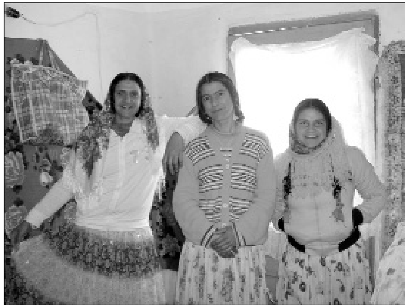
Femeile rrome din comuna Unirea spun că nu le-a vorbit nimeni, niciodată, despre educație sexuală

■ accesul limitat al romilor la serviciile medicale are consecințe negative și asupra educației sexuale, de care beneficiază doar 20% din cei din județ ■ romii au nevoie de proiecte făcute cu cap, nu doar de dragul de a mai bifa încă o activitate în caietul de sarcini ■ așa s-a întâmplat cu bursa locurilor de muncă ce s-a organizat special pentru ei, unde romilor li s-au oferit posturi de ingineri, sau li s-au cerut 10 clase pentru a da cu mătura ■ conducerea Autorității de Sănătate Publică Brăila susține că problemele romilor nu s-au născut din discriminare, ci chiar din lipsa de interes a acestora