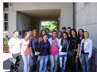
Participanții la cursul Rasismul în presă, Deva, iunie 2010

Sub titlul Presă și discriminarea , programul derulat în România a inclus și un modul de pregătire destinat elevilor din București, Craiova și Deva. Scopul acestuia a fost să explice legătura dintre presă și discriminare, dintre presă și interesul public, dar și modul în care