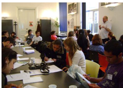
Rasismul în presă, București, aprilie 2010