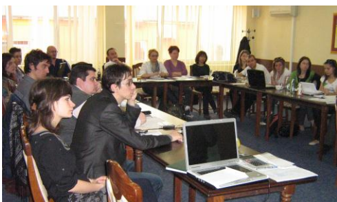
Analiza bugetului local, Cluj, mai 2010

Programul a fost finanțat de Uniunea Europeană prin programul PHARE Facilitatea de Tranziție 2007/19343.01.11- Consolidarea sprijinului societății civile în lupta împotriva corupției, în perioada ianuarie - octombrie 2010 .